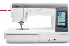
Horizon MC9450 QCP